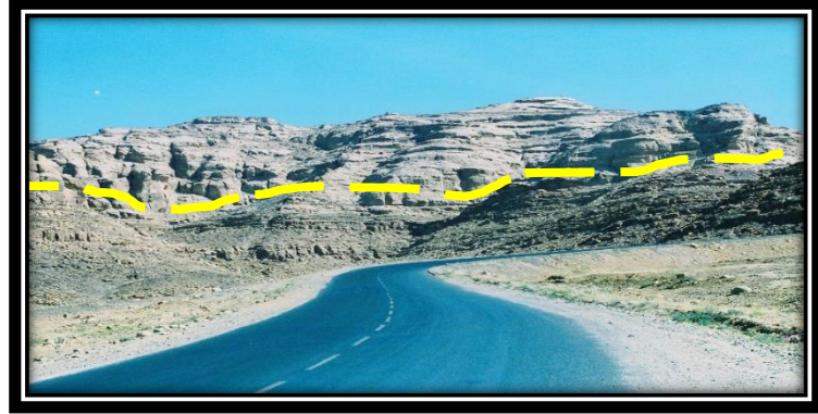
مكشّف يظهر فيه الحد الفاصل بين مجموعتي عمران والطويلة أسفل نقييل بن غيلان