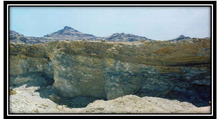
صورة مقربة للتتابع الرسوبي في مقلع الجبس - منطقة خلقة نهم- ويظهر في الأفق طبقات الطويلة ومن ثم يعلو الجميع صخور بركانيات اليمن