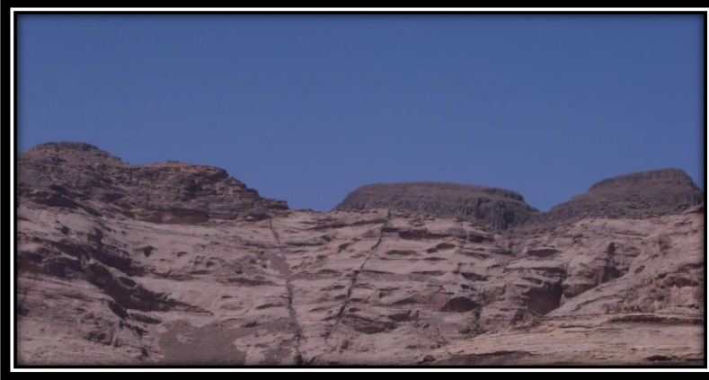
جبل عريشة، يظهر فيها الحد الفاصل بين مجموعة الطويلة ويعلوها صخور بركانيات اليمن "القبعات البازلتية"