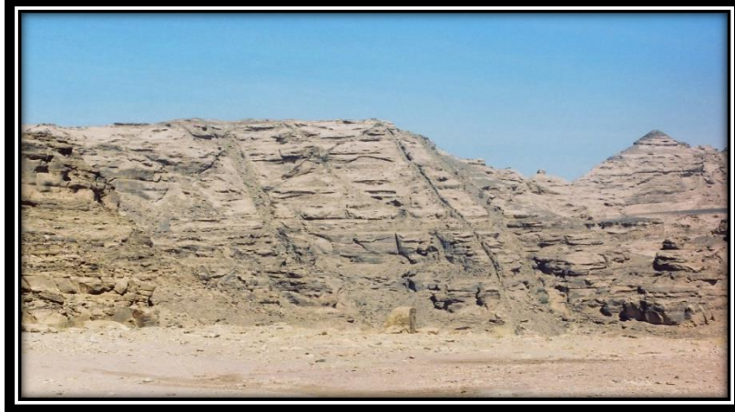
صخور مجموعة الطويلة يظهر فيها القواطع النارية - نقييل بن غيلان