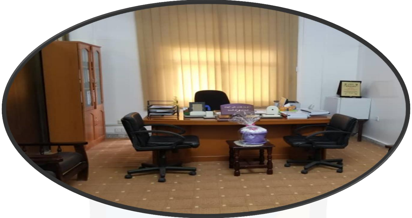
مكتب مديرة المركز

الرؤية: الريادة وبيت الخبرة الأول وطنياً في مجال التطوير وضمان الجودة.