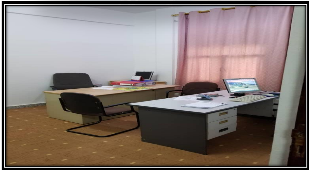
مكتب نائب مدير المركز

الرسالة: يسعى المركز إلى تحقيق التميز الأكاديمي والبحثي والإداري والخدمي للجامعة، والحفاظ على مكانتها كبيت الخبرة الأول في اليمن، من خلال تطوير الأداء الشامل، وضمان الجودة وصولاً إلى الاعتماد الوطني.