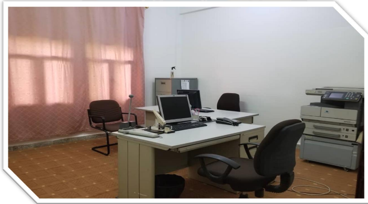
مكتب سكرتارية المركز