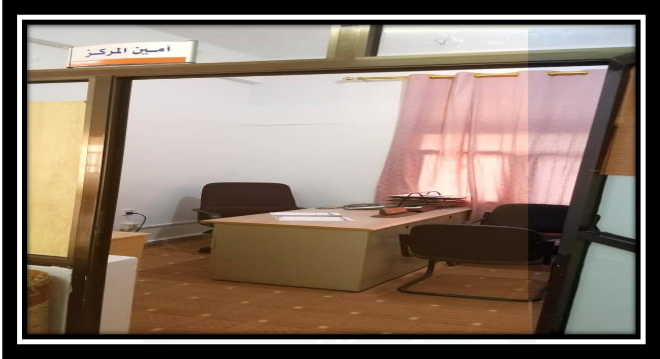
مكتب أمين المركز

الرؤية: الريادة وبيت الخبرة الأول وطنياً في مجال التطوير وضمان الجودة.