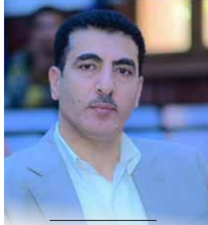
بقلم / رئيس التحرير